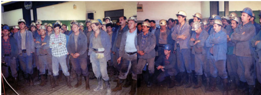
Fotografija 2: Iz arhive projekta Rudarske uspomene , Labin, 2008, projekt Kristine Leko u suradnji s bivšim rudarima i njihovim obiteljima. 22