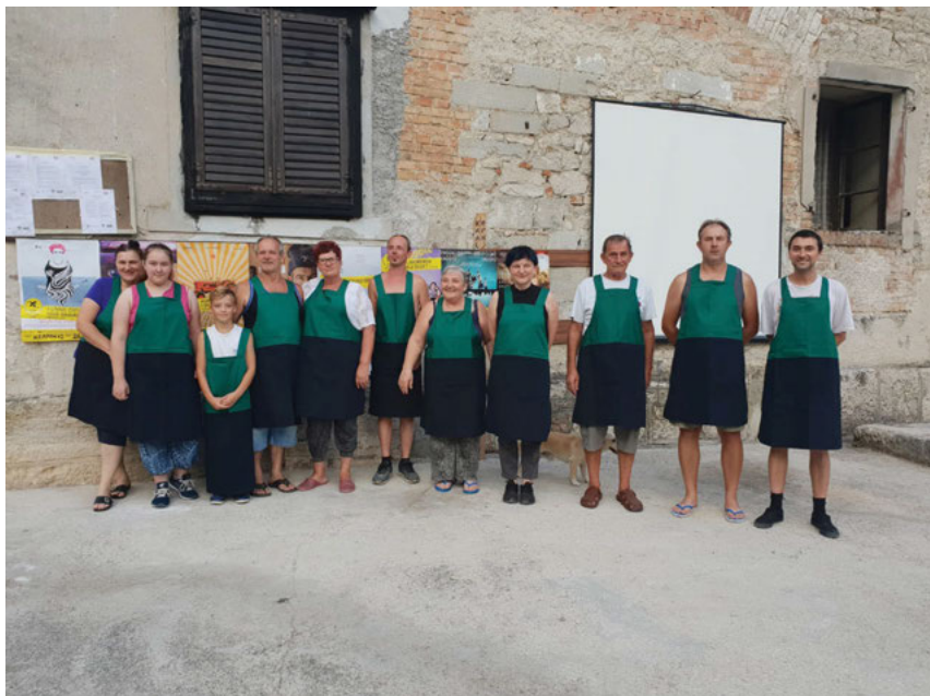
Fotografija 3: Polygonov arhiv, Regrutni centar za umjetnike Pozzo Franz, Krapan (2018) 23