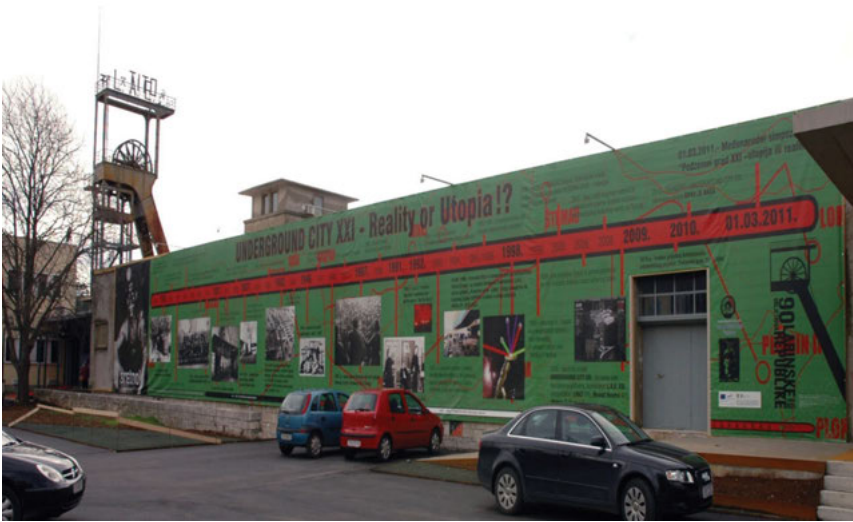
Fotografija 1: L.A.E. i KuC Lamparna 21