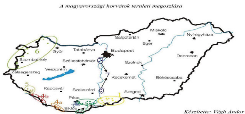
Slika 1. Hrvati u Mađarskoj

Hrvati su u Mađarskoj najraznovrsnija etnička skupina. Njihovo se doseljavanje odvijalo u vremenskom rasponu od 15. do 18. stoljeća, premda neke njihove skupine žive na području današnje Podravine već od 7. stoljeća. 2 Na dolje navedenoj karti Mađarske vidljivo je kako pripadnici hrvatske nacionalne manjine žive duž mađarske granice u sedam regija: u Baranji i Podravini, u Bačkoj, duž mađarsko-austrijske granice, u okolici grada Kaloče te u Zalskoj županiji i u Budimpešti. Hrvatska manjina ne čini kompaktnu i homogenu cjelinu, ali je jedna od 13 priznatih manjina, od kojih se ubraja među autohtone manjine čija prava su pored europskih regulativa zajamčena i najvišim pravno-političkim zakonom – Ustavom. Nakon uvođenja novog mađarskog Ustava (2012.) dotadašnji se izraz manjina zamijenio riječju narodnost i to se dosljedno rabi u svim dokumentima koji se odnose na Hrvate u Mađarskoj. Razlika između manjina i narodnosti ili etničkih skupina kao i pojam manjinskog jezika nije jednoznačno definiran, ali primarno pretpostavlja raznovrstan odnos prema većinskom jeziku te krije u sebi obilježja jezične zajednice i prepoznatljivih sociokulturoloških čimbenika, stoga se u daljnjem tekstu rabe pojmovi manjina i manjinski jezik .